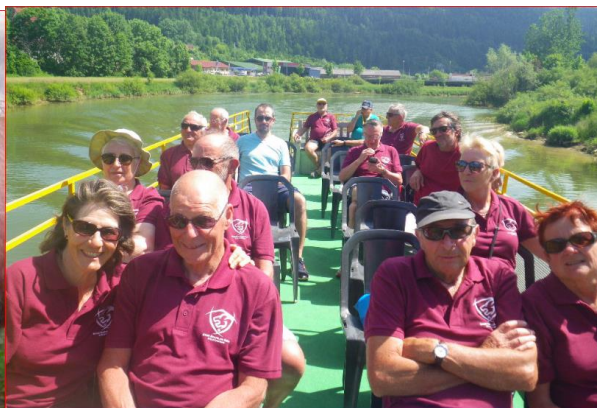
Un gastéropode géant, très courant dans la région, et une escapade en bateau sur le Lac de Villers en direction du Saut du Doubs, avec tout le groupe (manque le photographe !!!).