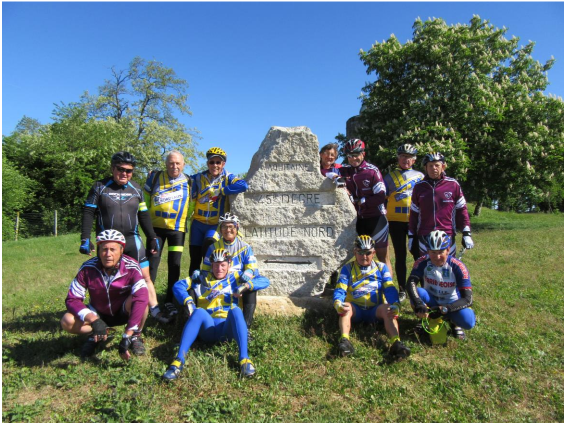
Tir groupé au château Eyquem sur les bords de Gironde