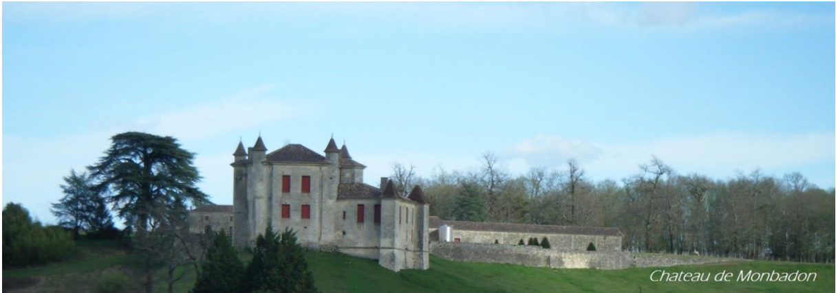
Chateau de Monbadon