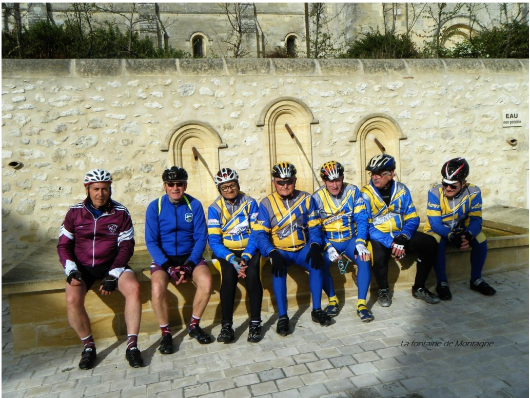
La fontaine de Montagne