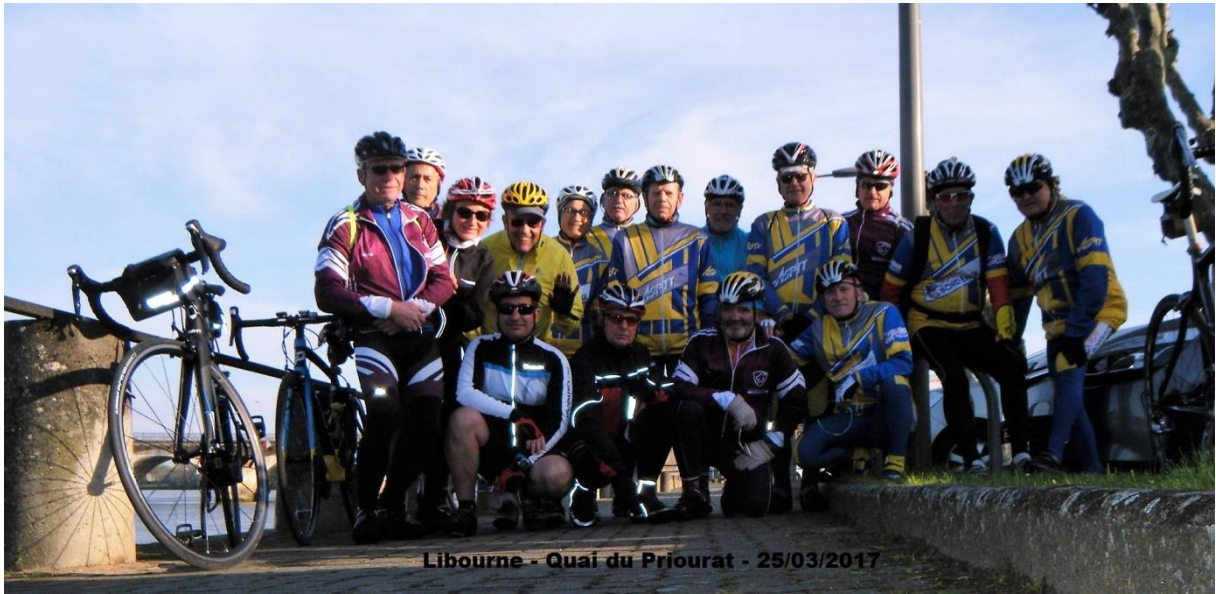
Libourne - Quai du Priourat - 25/03/2017